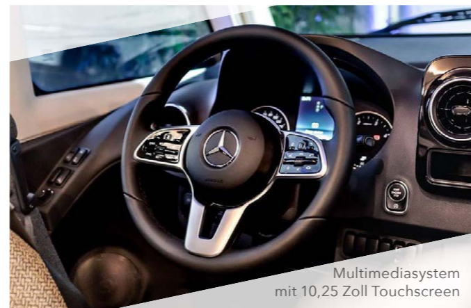
Multimediasystem mit 10,25 Zoll Touchscreen