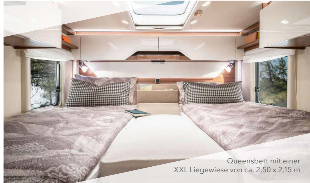
Queensbett mit einer XXL Liegewiese von ca. 2,50 x 2,15 m