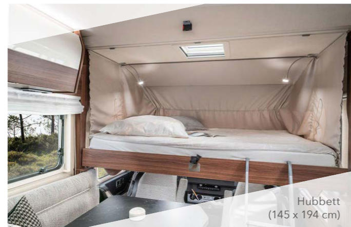
Hubbett (145 x 194 cm)

Lernen Sie die einzigartige Atmosphäre der neuen Hymer „Modern Comfort“ Klasse kennen. Harmonische Möbelformen in Kombination mit der neuesten Technik verleihen der neuen Hymer Klasse ein unverwechselbares Flair. Erleben Sie die neue Hymer Klasse - erleben Sie den neuen Reisekomfort.